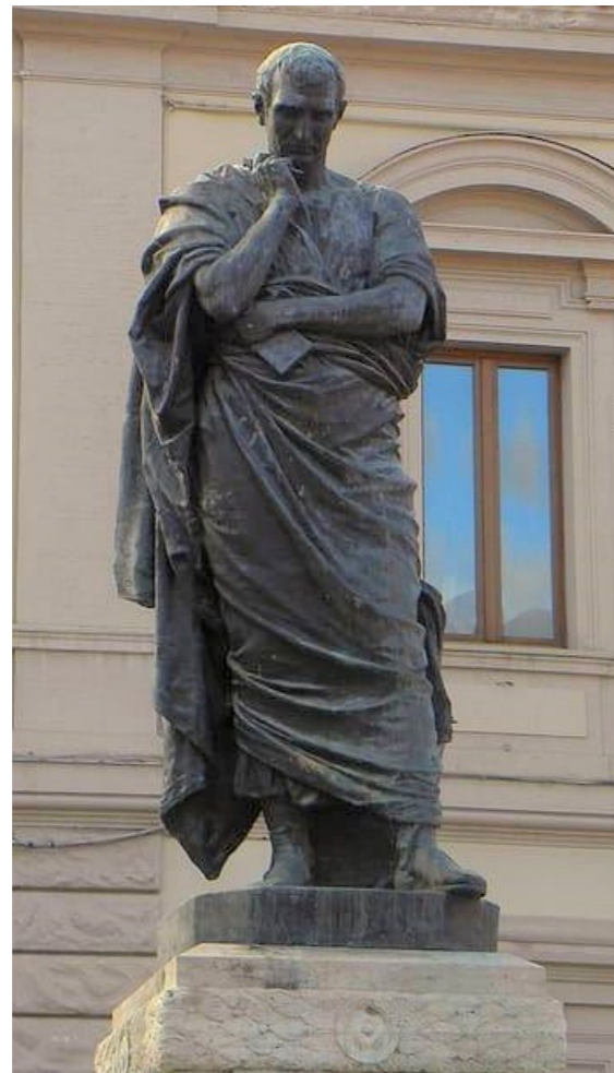
Statue des Ovid in Sulmona, Italien.

aus Ovids Metamorphosen transkodiert werden, in ihrer Identitätskonstruktion und in der Darstellung ihrer Emotionen? Inwieweit definiert das ovidianische Paradigma die Inszenierung des Ich-Sprechers? Was ist die Grenze zwischen Fiktionalität und Wahrheit,