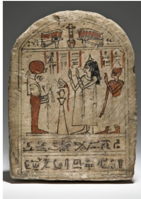
Stela of the woman Tjereri with her son (?), worshipping Re-Harakhte; Graeco-Roman period. Height 31.5 cm. SMÄK ÄS 47.

In concluding, it's important to emphasize what is missed through working remotely and delivering lectures online. In addition to the wonderful environment and facilities in Munich, time spent with people – colleagues, students, visitors, and others – was central to the semester when I was present in LMU. The stereotype of an intellectual life that has its home in cafes may not be the whole truth about Munich, but it is not so far short. Many people, notably those who run the