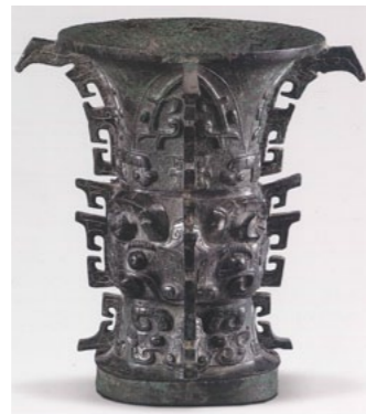
He zun (Hes Libationsgefäß). Die Inschrift zitiert eine Königsrede, die an die Eroberung von Shang und die Dynastiegründer Wen und Wu erinnert.

In meinem kürzlich abgeschlossenen Projekt untersuchte ich, wie die Erinnerung an die Eroberung von Shang und die ersten Zhou-Könige vor der Verfassung von Klassikern überliefert wurde. Als Quellen dienen Inschriften auf ausgegrabenen Bronzegefäßen und -glocken, welche während der Zhou-Zeit Ahneneremonien in aristokratischen Lineages begleiteten. Die Eroberung und die Dynastiegründer werden in wenigen Inschriften erwähnt. Einige Stifter gehörten zu Teilnehmern des Feldzugs gegen die Shang. Spätere Erinnerungen an die Dynastiegründung befinden sich in den in Inschriften zitierten Reden herrschender Könige. Sie richteten sich meist an Oberhäupter wichtigster mit dem Königshaus verwandten Lineages. Die Erinnerungspflege diente vor allem der Identitätsstiftung im patri-linearen Netzwerk der Fürstentümer.