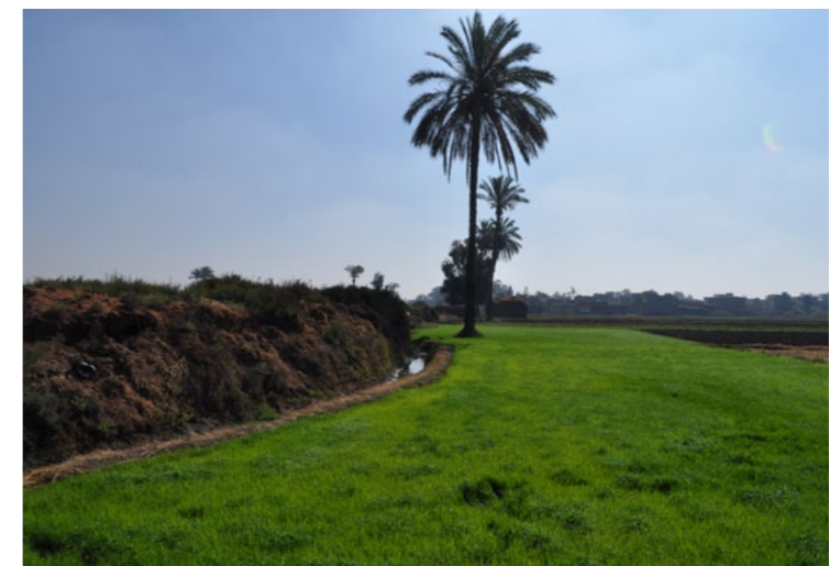
Griechisch-römische Siedlung Kom el-Gir im nordwestlichen Nildelta, Ägypten. Abbruchkante des antiken Siedlungshügels zu den umliegenden Feldern.

Landeshälften Ägyptens weiter verschärfte. Vor diesem Hintergrund muss sich jedes Projekt im Nildelta mit ganz grundlegenden Fragen beschäftigen: Wie sah die antike Landschaft aus und ab wann und in welcher Form war diese Region besiedelt? Dies gilt auch für das Untersuchungsgebiet im Nordwesten des Deltas, um den bedeutenden Fundplatz Buto (Tell el-Fara'in). Hier wurde unter der Ägide