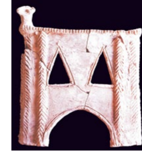
Spätbronzezeitliches Architekturmodell (Hausmodell).

Das Ausgrabungsteam hat die Forschungsergebnisse zwar veröffentlicht, eine systematische Analyse zur Interpretation der Besiedlungsgeschichte steht aber noch aus. Sowohl die archäologischen als auch die schriftlichen Quellen zeigen, dass die spätbronzezeitlichen Siedlungen am Oberen Euphrat (Tall Munbāqa, Meskene, Tall Hadidi, Tall Bazi und Tall El-Oitar) viele Eigenschaften gemeinsam haben. Die Ähnlichkeiten liegen vor allem in den Architekturformen, der Sozial- und Verwaltungsstruktur, den Formen der Keilschrifttafeln und darin verwendeten Formulierungen. Tall Munbāqa bietet aber als einziger Fundort die Möglichkeit, weitreichende Verknüpfungen zwischen den Quellengattungen herzustellen, und so die Siedlungsstruktur und das dynamische Verhältnis zwischen den