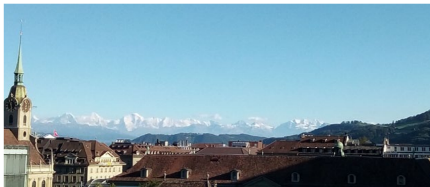
Bern, Blick von der Grosse Schanze, Berggipfel links im Bild: Finsteraarhorn, Eiger, Mönch, Jungfrau.

Alma Brodersen Universität Bern Alumna der GSDW