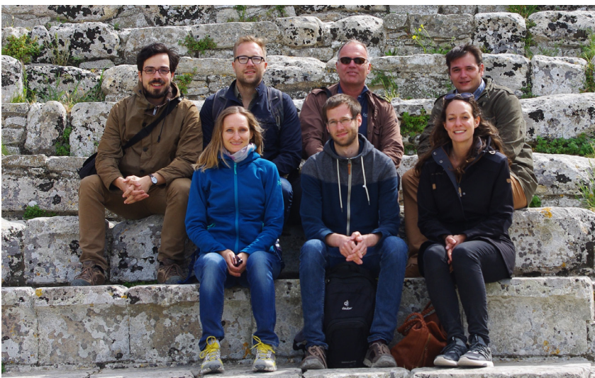
Die TeilnehmerInnen der Exkursion im Theater von Segesta

in perfekter Symbiose mit Topographie und Umland. Sie lässt sich umso mehr an den griechischen Poleis von Selinunt und Agrigent beobachten. Deren Tempel demonstrieren durch Anzahl und Größe das Selbstbewusstsein der westgriechischen Kolonien. Selinunt monumentalisierte sogar seine Bürgerhäuser und schaffte damit ein einheitliches Stadtbild, das Rückschlüsse auf soziale Hierarchien nicht zulässt. In