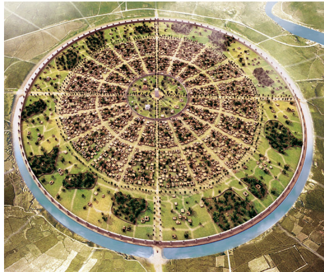
Rekonstruktion von Gor

Heimatprovinz Fars, die geschichtsträchtige Persis. Obwohl Ktesiphon ab 226 die politische Hauptstadt des Reiches war, zeigen die sasanidischen Hinterlassenschaften in Fars, darunter über 30 monumentale Felsreliefs, Inschriften und Baureste, dass diese Provinz in der Entstehungszeit des Reiches eine zentrale Rolle spielte. So wie die Persis für die Achaimeniden war Fars die bevorzugte Region der