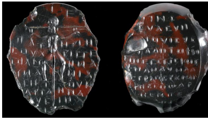
Green and red jasper gem with an image of the crucified Jesus and inscriptions, ca. 200 C.E., British Museum G 1986,5-1,1.

One of the most remarkable examples is a “magical” gem from the eastern Mediterranean (probably Turkey or Syria), which is now housed in the British Museum (see foto below). This gem provides the earliest extant image of the crucified Jesus (ca. 200 C.E.). Jesus is seen here suspended from a “Tau Cross,” with his head in profile, his