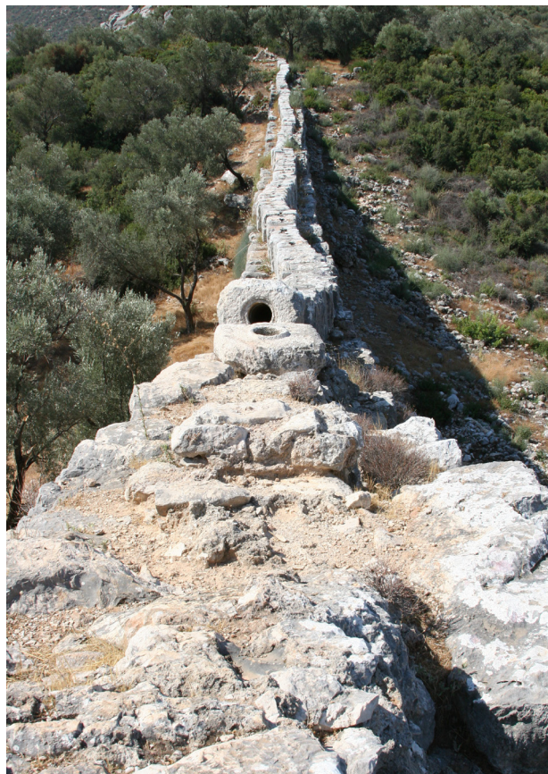
Die Druckwasserleitung von Patara in Lykien

mit bereits archaischen und klassischen Wasserbauten befinden. Es lässt sich also sehr spezifisch analysieren, welche Akteure und Faktoren die beinahe flächendeckende Ausbreitung von Fernwasserleitungen