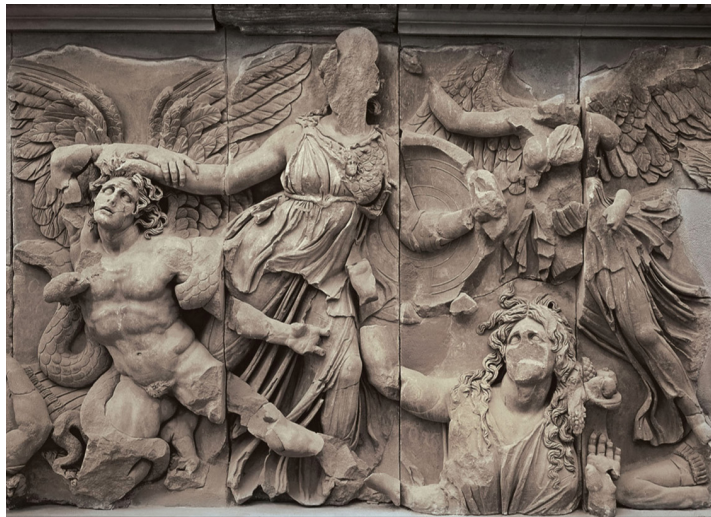
Pergamonaltar, Athena und Alkyoneus. Berlin, Pergamonmuseum

pomorphic and often associated with darker forces of the world. Coming from peripheral branches of the divine family tree, these non-Olympian divinities live 'far from gods and men', hidden at the margins of Olympus-centred mythologies, geographies and narratives. Often standing in contrast to Olympians and their ways, nethergods nonetheless perform crucial – even if underappreciated – roles in upholding the regime of Zeus, which the speakers will investigate in detail.