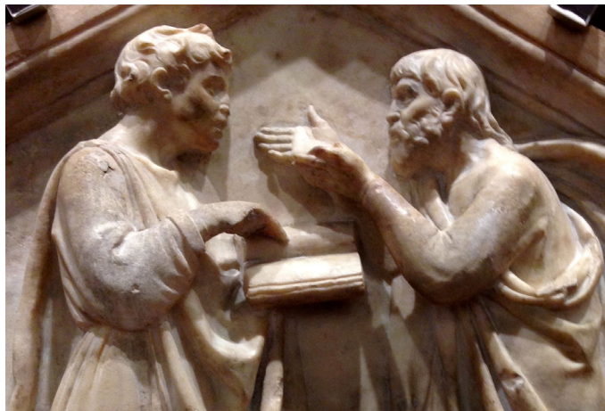
Plato and Aristotle, Luca della Robbia, Museo dell'Opera del Duomo, Florence

The project first surveys how the concept of a 'non-written style' emerges and is then developed into the prevalent contrast between the written and 'the agonistic' by early rhetoricians. Should we accept the